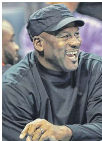
Michael Jordan (50) ist Vater von Zwillingen geworden.